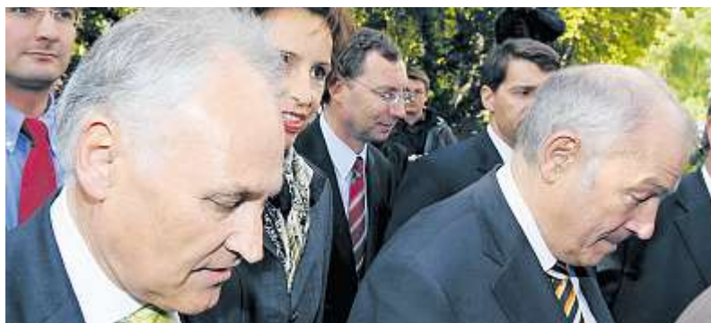
Nach dem Rücktritt von Erwin Huber (l.) und Christine Haderthauer (daneben) gerät auch Günther Beckstein (r.) unter Druck.

onspartnern FDP und Freie Wähler beginnen. Fast zeitgleich zu Hubers Rückzug sorgte eine Meldung der Münchner „Abendzeitung“ über angebliche Rücktrittsabsichten Becksteins für Wirbel. Die Staatskanzlei dementierte dies umgehend. Ihr Amt niederlegen wird aber CSU-Generalsekretärin Christine Haderthauer.